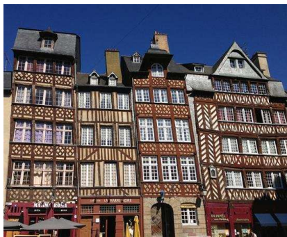
Cœur Historique de RENNES