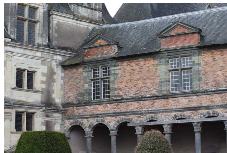
Centre historique de CHÂTEAUBRIANT

22h00 - Collation, suivie de la 2ème partie de la "Soirée des Sections"