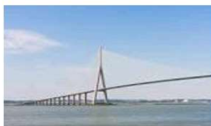
LE PONT DE NORMANDIE